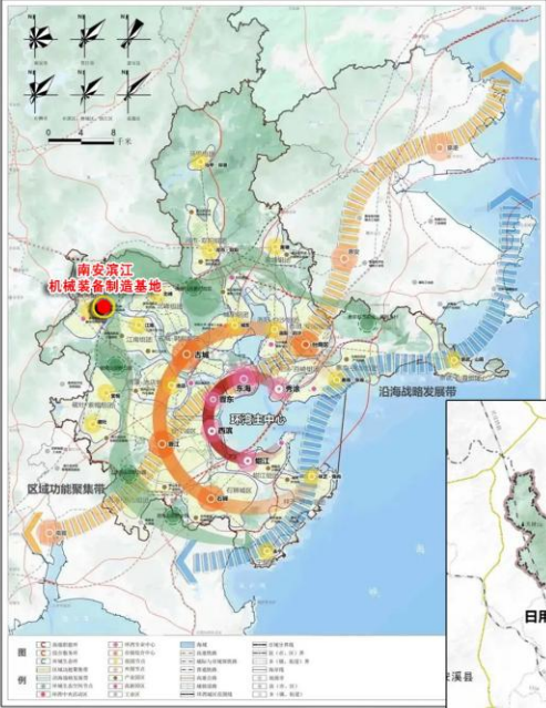
一. 南安滨江装备制造基地在泉州湾的位置: