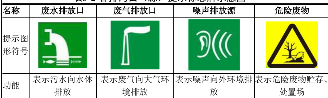
表5-2 各排污口（源）提示标志牌示意图

③建设单位应将有关排污口的情况，如：排污口的性质、编号，排污口的位置；主要排放的污染物种类、数量、浓度、排放规律、排放去向；污染治理设施的运行情况等进行建档管理，并报送环保主管部门备案。