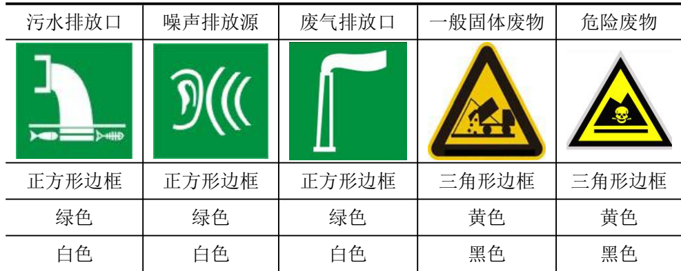
表 5-2 厂区排污口图形符号（提示标志）一览表

规范化排放口：排放口应预留监测口做到便于采样和测定流量，并设立标志（有要求监控的项目应论述）。执行《环境图形标准排污口(源)》(GB15563.1-1995)及《环境保护图形标志-固体废物贮存(处置)场》(GB15562.2-1995)。见表 5-2，标志牌应设在与之功能相应的醒目处，并保持清晰、完整。